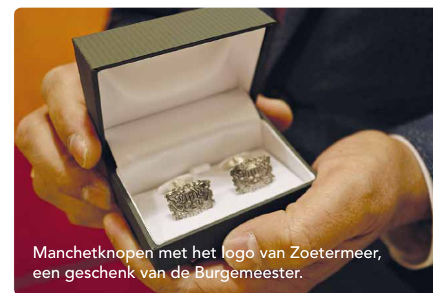
Manchetknopen met het logo van Zoetermeer, een geschenk van de Burgemeester.

In de huidige wereld van digitale technologie moeten bedrijven steeds sneller transformeren. Tien jaar geleden hadden bedrijven minstens vijf jaar de tijd om te schakelen naar nieuwe technologieën, denk maar aan internet. Maar momenteel is dat slechts 18 tot 24 maanden. Dit jaar streeft NINtec ernaar om tussen de 75 en 100 professionals, gericht op technologie-transformatie, vanuit hun wereldwijde vestigingen naar Zoetermeer te brengen. Voor een periode van drie jaar gaan zij werken vanuit het hoofdkantoor. "Een internationaal gezelschap kan Zoetermeer nóg meer een kennis en ICT-